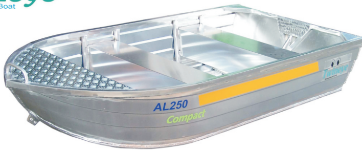
Side View ภาพด้านข้าง